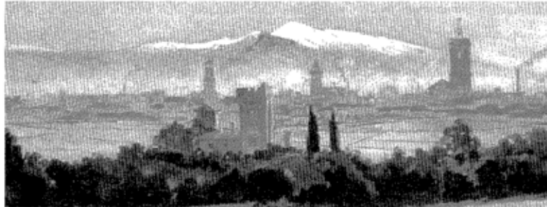
Fragmento de un óleo de Joan Vila Cínc

Las obras destacables son las de Vila Arrufat, que resalta como el mejor artista local. Y Joan Vila Cínc, que con su "Jardí del Castell de Can Feu" rusiñolesco, y su "Portal del Cementerio del Taulí", urgellesco, y su excelente "Panorámica", de 1910, encargada por el Gremio de Fabricantes de la Ciudad para su estante en la Exposición Internacional de Buenos Aires de 1910 -obra de más de cinco metros de ancho-, aporta la mejor selección de la muestra.